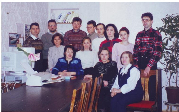
Коллектив Лаборатории водных экосистем, 1999 год