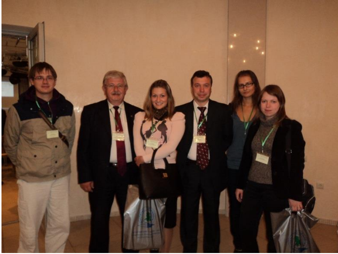
Плаксинские чтения, город Петрозаводск, сентябрь, 2012 год