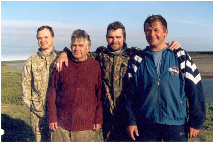
Участники международной экспедиции по проекту Spice, Архангельская область, 2002 год