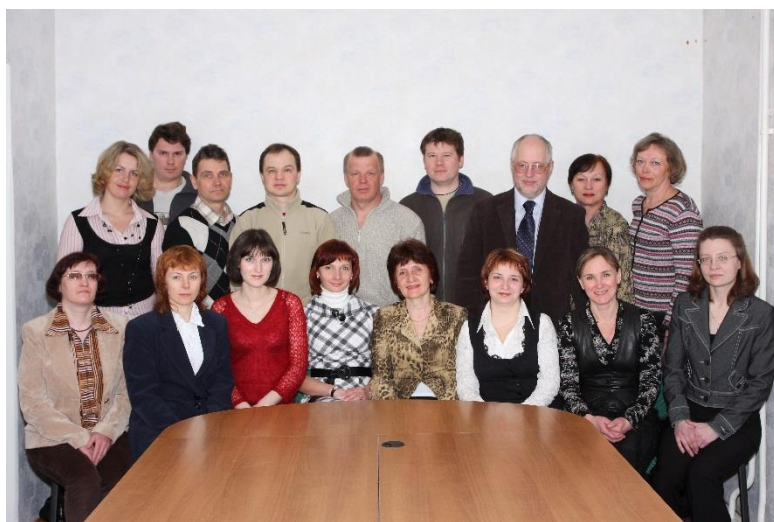
Коллектив Лаборатории водных экосистем, 2009 год