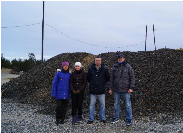
Рудный склад, поселок Приречный, октябрь, 2016 год