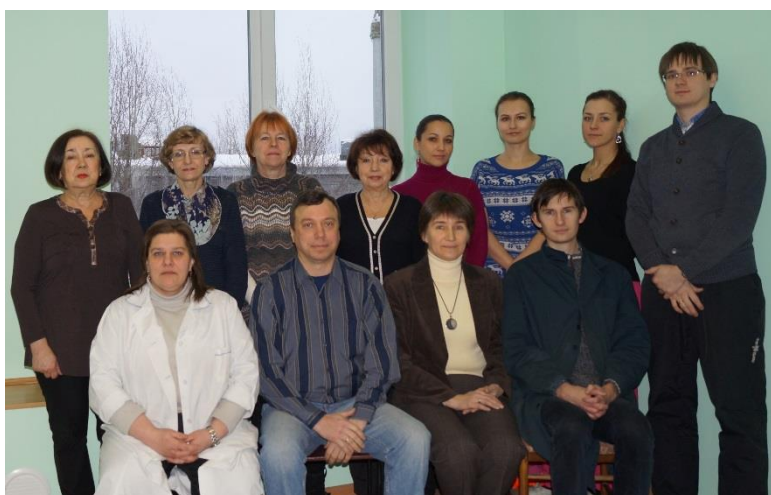
Лаборатория экологии промышленного производства, 2015 год