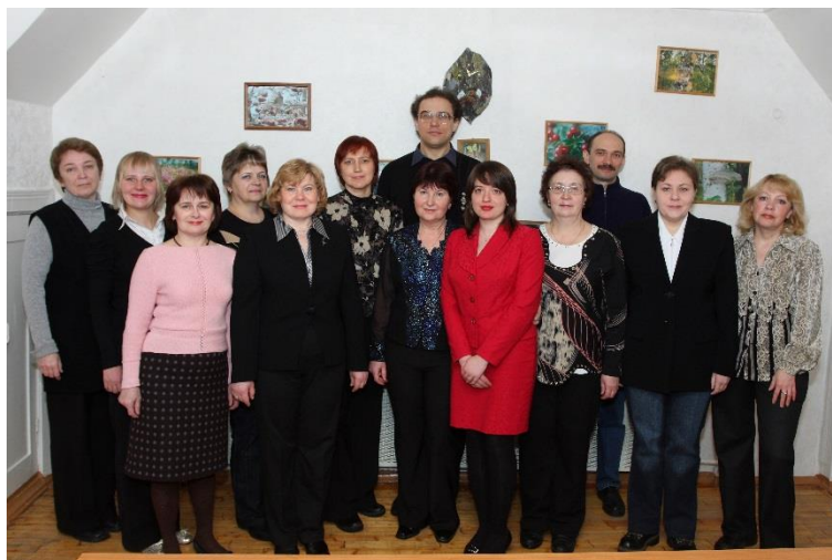
Сотрудники Лаборатории наземных экосистем, 2009 год