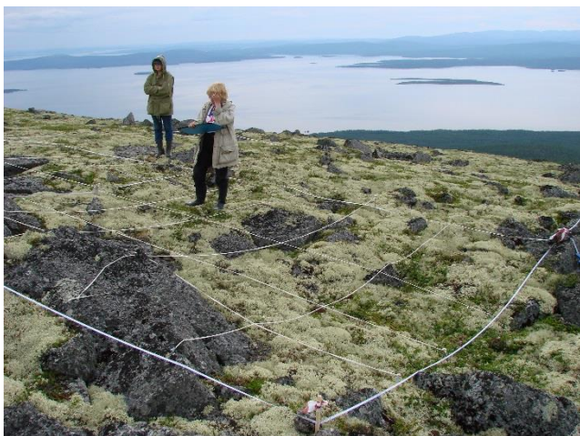
Описание растительности на постоянных площадках в экотоне лес — лесотундра — тундра, 2008 год