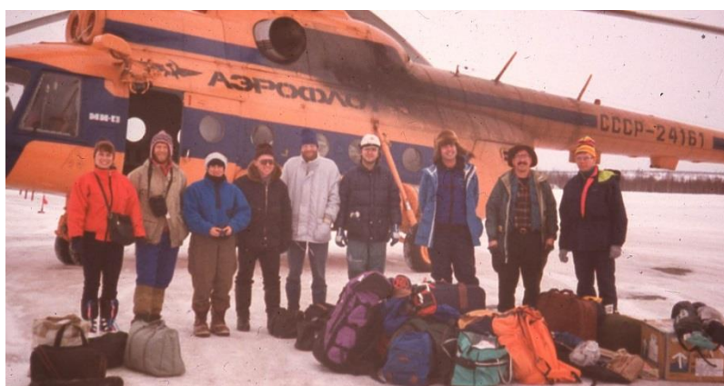
Участники международной экспедиции по проекту Arctic, 1991 год