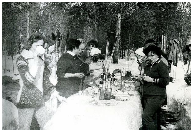
«На яме». Апрель, 1983 год