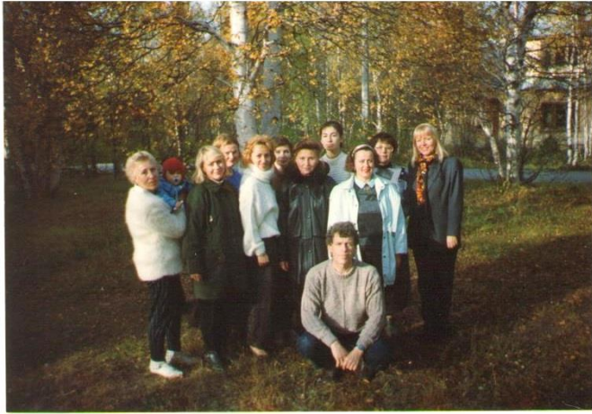
Сотрудники Лаборатории наземных экосистем в Академгородке, 1995 год