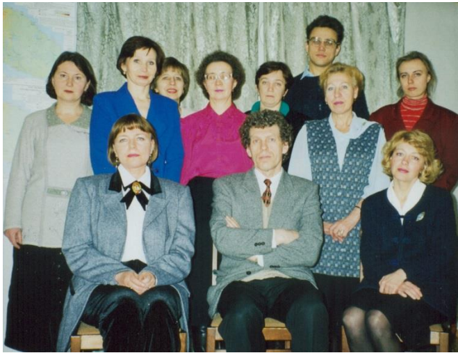
Сотрудники Лаборатории наземных экосистем, 1999 год