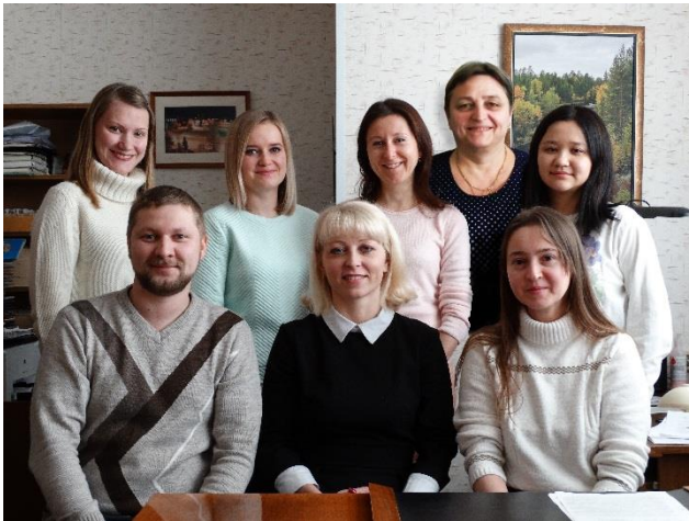
Коллектив Лаборатории экологии микроорганизмов, 2017 год