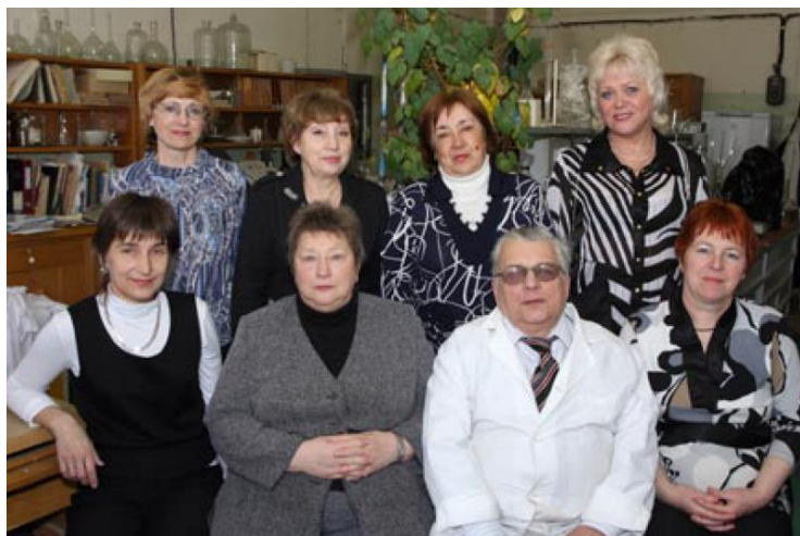
Лаборатория экологии промышленного производства, 2009 год