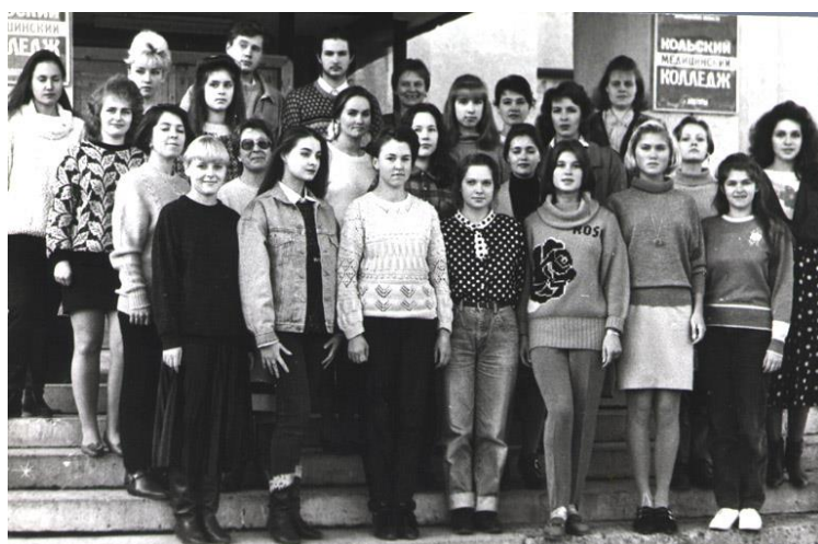
Первый выпуск экологического факультета Апатитского филиала Петрозаводского государственного университета, 1999 год