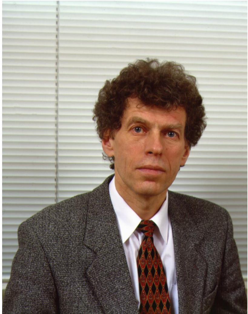
Вячеслав Васильевич Никонов