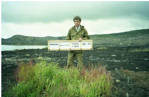
Экспериментальные площадки по восстановлению напочвенного покрова на техногенных пустошах в окрестностях пгт. Никель, 1999 год