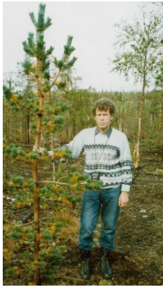
Эксперименты с внесением мелиорантов для повышения жизненности соснового редколесья на мониторинговой площадке в окрестностях города Мончегорска, 1999 год